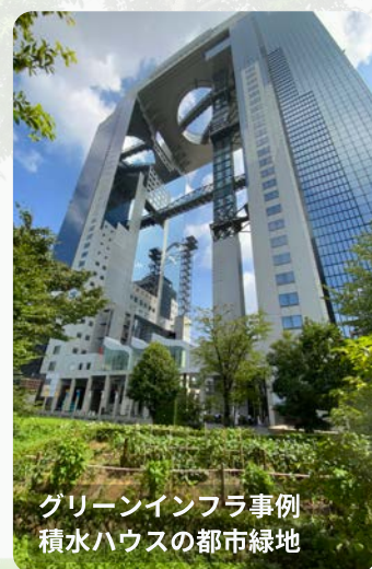
グリーンインフラ事例 積水ハウスの都市緑地