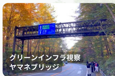
グリーンインフラ視察 ヤマネブリッジ