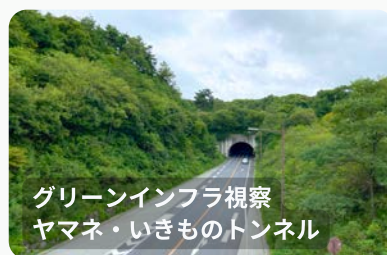
グリーンインフラ視察 ヤマネ・いきものトンネル